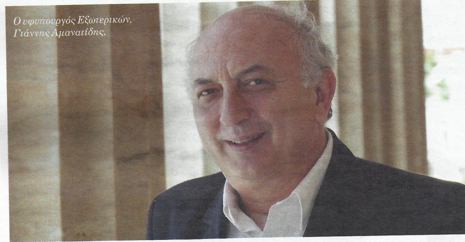
Ο υφυπουργός Εξωτερικών, Γιάννης Αμαναϊτίδης.